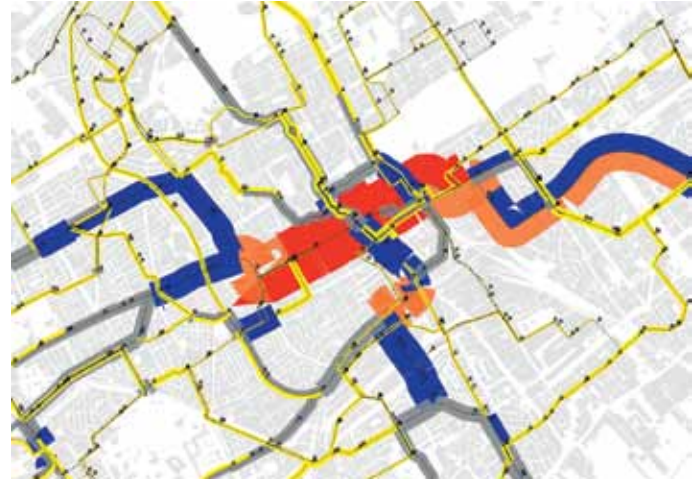
Figuur 1: Fictief voorbeeld van reizigersbezettingen. De kleuren en de dikte geven de bezetting op de ov-trajecten aan.

De hierboven beschreven techniek is snel en goedkoop. Het wordt dus mogelijk om veel meer scenario's te analyseren dan vroeger. In plaats van het toetsen van een voorgenomen besluit kunnen we allerlei scenario's exploreren en uiteindelijk de